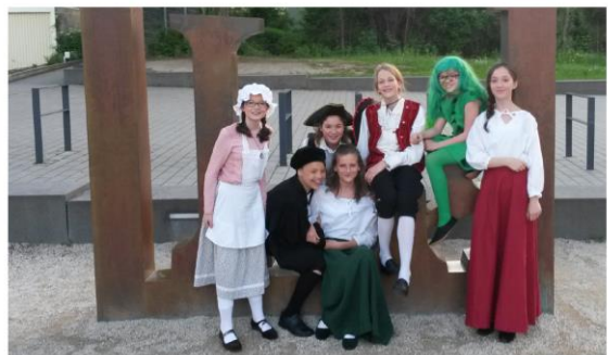
Elternbrief 2017/18, 1. Halbjahr