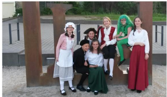
Elternbrief 2017/18, 1. Halbjahr